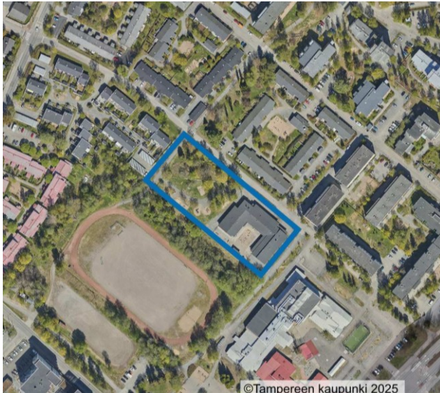
Suunnittelualueen rajaus ilmakuvassa