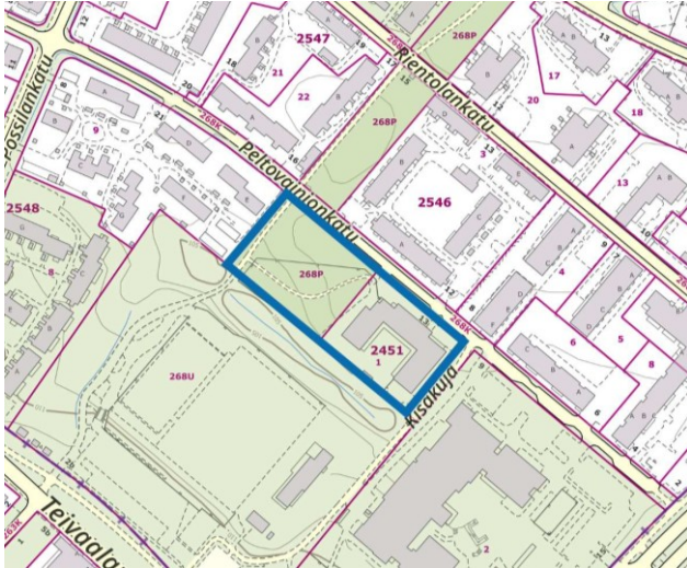
Suunnittelualueen rajaus virastokartalla